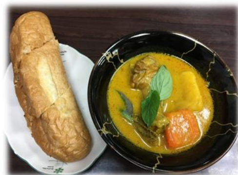
Bánh mì Canh càry gà