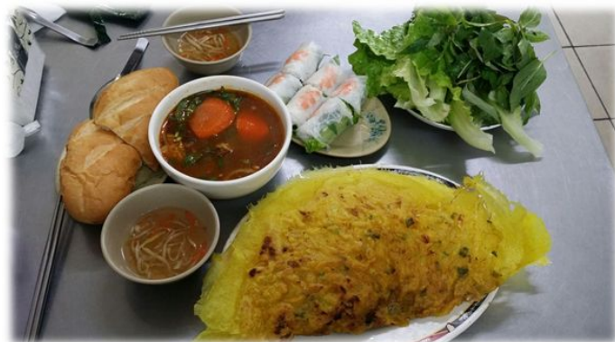
Canh bò kho Gỏi cuốn Bánh xèo