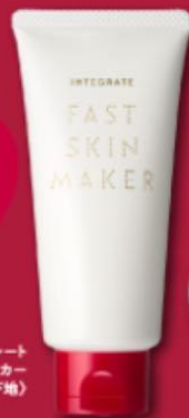
インテグレート ファストスキンメーカー 〈ふきとり洗浄・保湿液・化粧下地〉