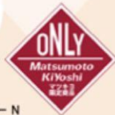
インテグレート フラットスキンメーカー N 〈保湿液・ファンデーション〉