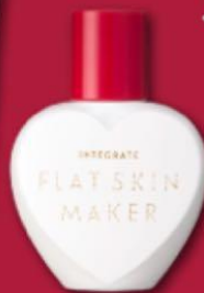
インテグレート フラットスキンメーカー N 〈保湿液・ファンデーション〉